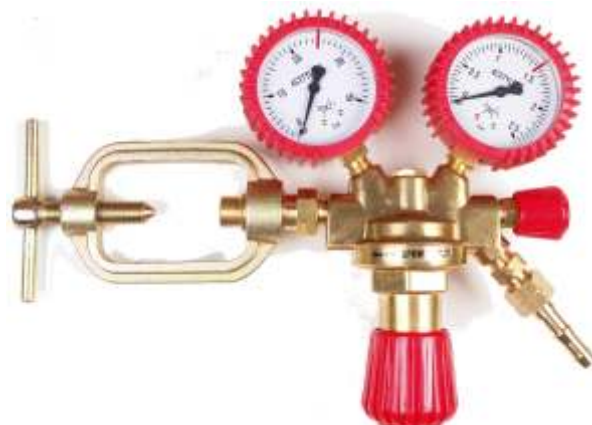
Acetylen seria 100