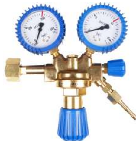
Tlen seria 100