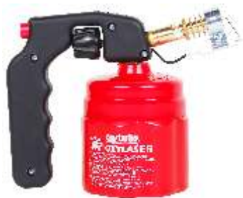
P. LP OXY STAL