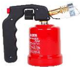
P. LP OXY PLAP