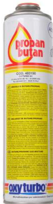
Propan - butan 330g