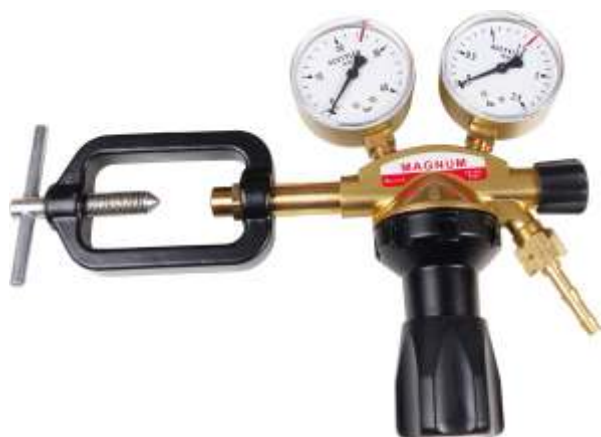
Acetylen seria 80