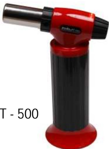
PT - 500