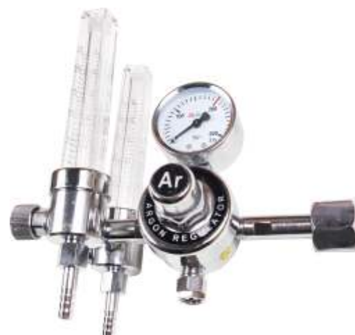
Ar/CO 2 + 2 rotametry