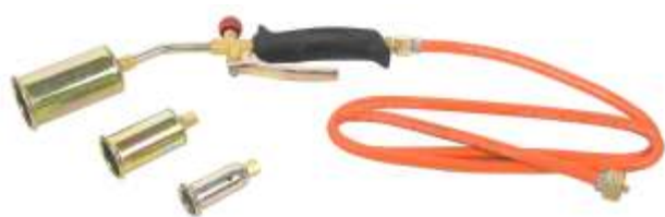
P. GP 281 LAM