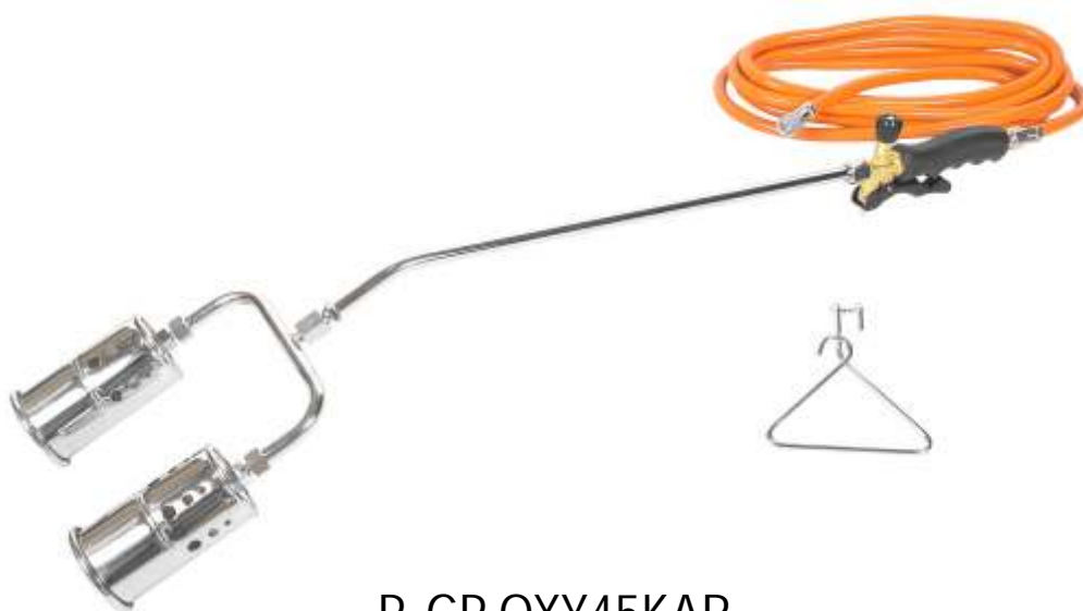
P. GP OXY45KAR