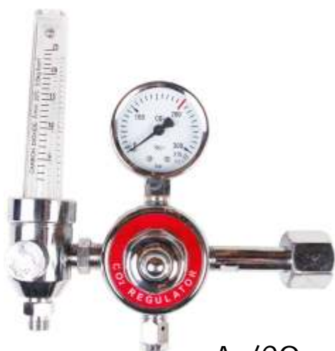
Ar/CO 2 + 1 rotametr + podgrzewacz