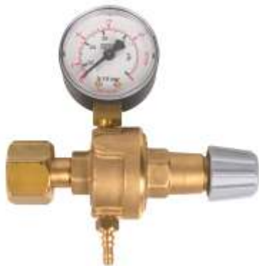
Ar/CO 2 seria MINI