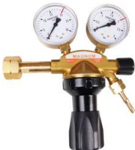
LPG seria 80