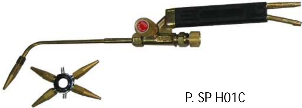
P. SP H01C