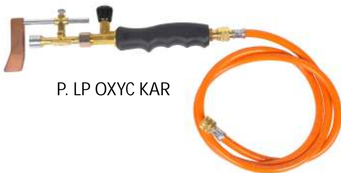
P. LP OXYC KAR