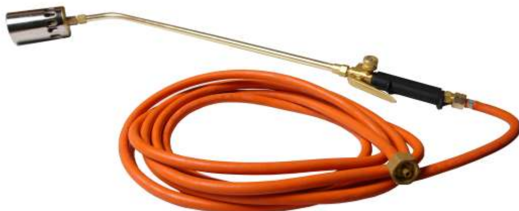
P. GP OXY60KAR