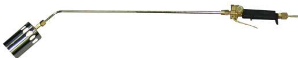
P. GP 231