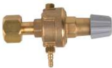
Ar/CO 2 seria MINI