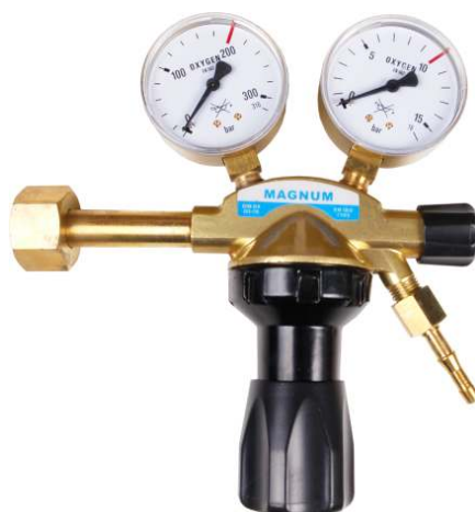
Tlen seria 80