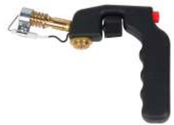
P. LP UCH 7/16