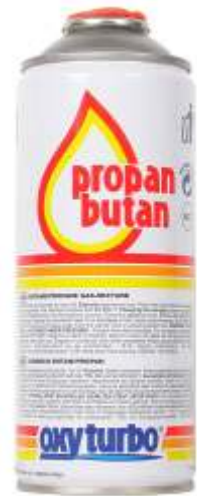
Propan - butan 210g