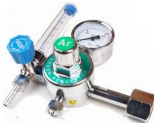
Ar/CO 2 + 1 rotametr