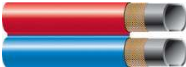
Acetylen + Tlen (TWIN)