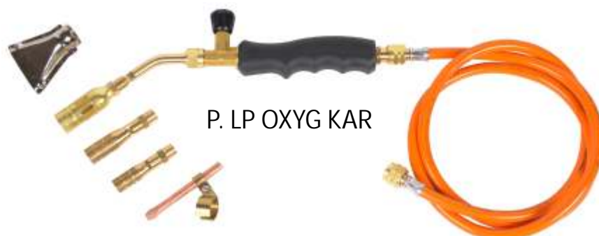
P. LP OXYG KAR