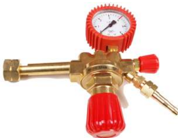
LPG seria 100