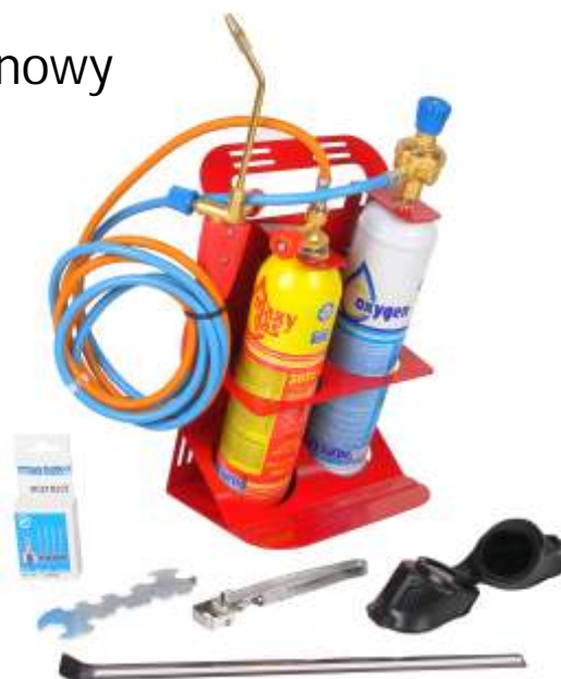
Zestaw propanowo-tlenowy TURBO SET 90