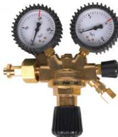
Azot seria 100