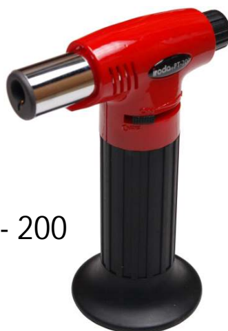
PT - 200