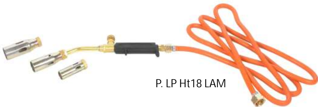
P. LP Ht18 LAM