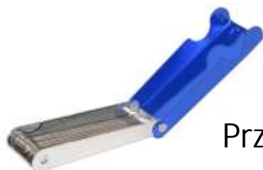
Przetyczki „TIP” do palników