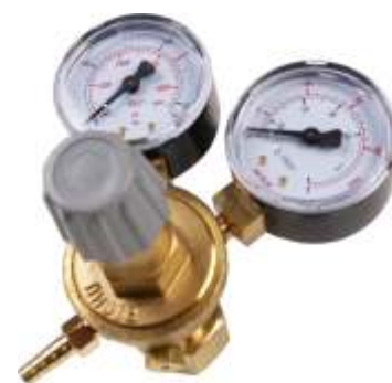
Ar/CO 2 seria MINI