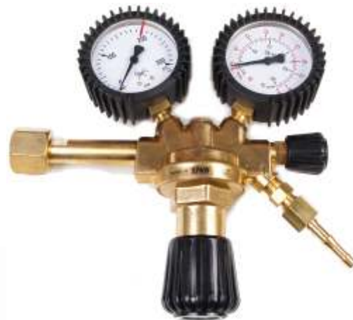
Ar/CO 2 seria 100