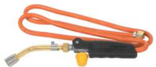
P. LP HT19FLAM