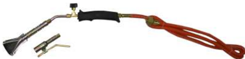
P. GP 291 LAM