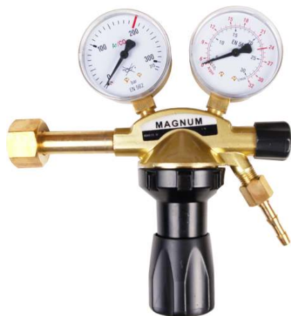
Ar/CO 2 seria 80