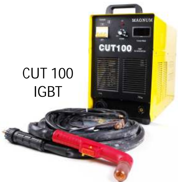
CUT 100 IGBT